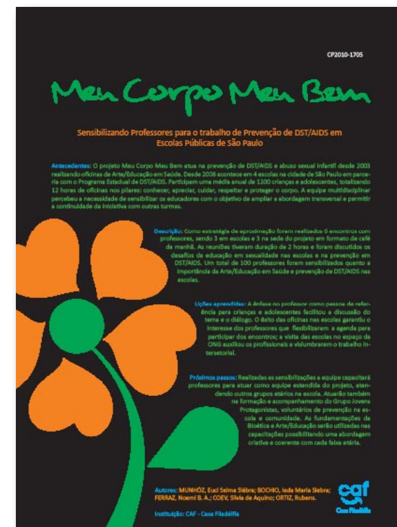
Poster do Projeto Meu Corpo Meu Bem apresentado no VIII Congresso Brasileiro de Prevenção das DST e AIDS em Brasília.