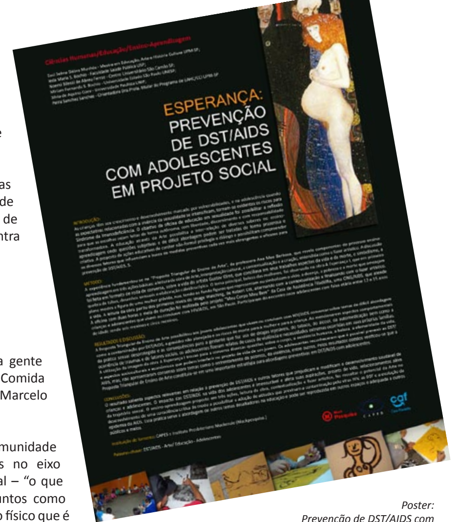
Poster: Prevenção de DST/AIDS com adolescentes em Projeto Social. Projeto Meu Corpo Meu Bem.